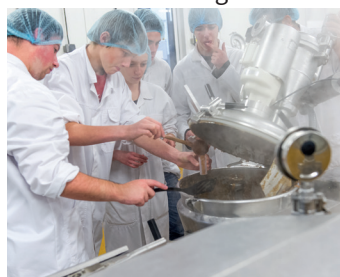
TP en halle de technologie