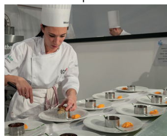
TP en cuisine pédagogique