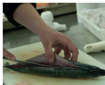
TP en labo poissonnerie