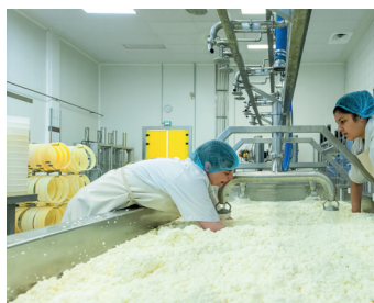
TP en fromagerie

Cette taxe est le seul impôt pour lequel il vous est possible de choisir le destinataire, donc l'ENILV. Cet impôt est donc une réelle opportunité puisque vous pouvez l'investir au service du développement de votre entreprise.