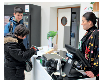
TP en magasin pédagogique