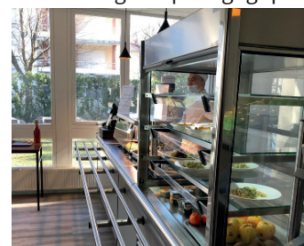
TP en self pédagogique