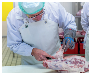
TP en salle de découpe